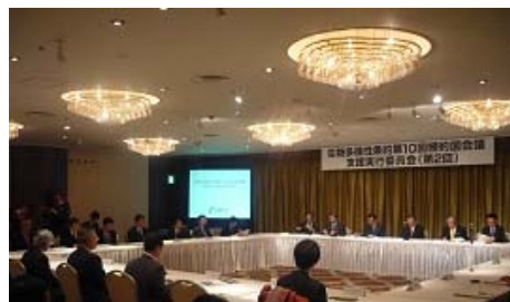
支援実行委員会の様子

また、外務省や環境省などの委員から、日本政府の取組情報など本格的な準備にむけ報告がありました。